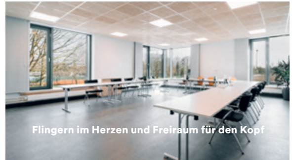
Flingern im Herzen und Freiraum für den Kopf

Mitten in Düsseldorf und dem Trendviertel Flingern gelegen, laden die designorientierten Räumlichkeiten freundlich und offen zum kommunikativen Miteinander. Ein weiteres Highlight ist der direkte Blick in das Freibad. Der 62 qm große Veranstaltungsraum kann bei Bedarf in zwei Räume geteilt werden. Interieur und Catering können optional individualisiert werden.