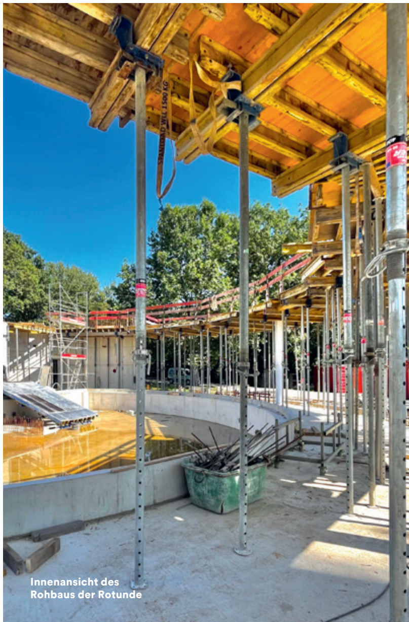
Innenansicht des Rohbaus der Rotunde

„Wir arbeiten Hand in Hand, damit den Düsseldorfer Wasserfreunden bald noch mehr Möglichkeiten zur Verfügung stehen.“