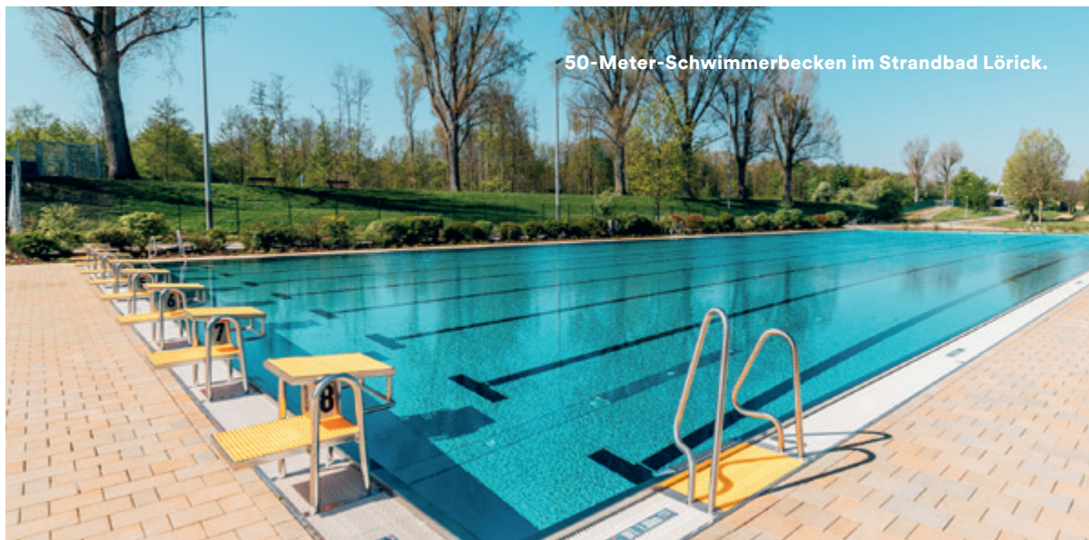
50-Meter-Schwimmerbecken im Strandbad Lörick.

Mehr Wasserzeit und weniger Warteschlange: Online-Ticket buchen und noch schneller ins Wasser springen!