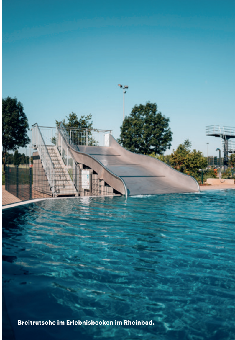
Breitrutsche im Erlebnisbecken im Rheinbad.

ÖPNV: Linie 833 – Haltestelle „Strandbad Lörick“