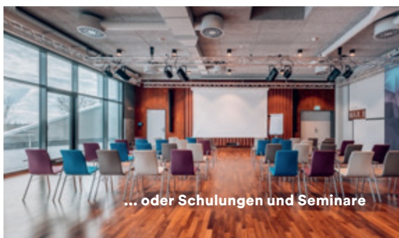
... oder Schulungen und Seminare

Veranstaltungen von A bis Z – private Highlights wie Hochzeiten, Geburtstage, Vereinsitzungen, aber auch Sportveranstaltungen, Firmenevents, Tagungen und Seminare, Schulungen oder Produktvorführungen, finden in den Räumlichkeiten der Düsseldorfer Bäder eine einzigartige und unvergessliche Umgebung. Die folgenden Bäder bieten verschiedene Räume und Möglichkeiten: