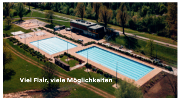
Viel Flair, viele Möglichkeiten

Eine besondere Outdoor-Location für besondere Momente. Hochzeiten, Verlobungen, Foto-Events, aber auch Vereinsfeste, Jubiläen oder Firmenfeiern können auf den direkt am Rhein gelegenen Grünflächen zelebriert werden. Der 30.000 qm große Parkplatz ist ebenfalls ein beliebtes Mietobjekt und bietet zahlreiche ungewöhnliche Möglichkeiten – informieren lohnt sich.