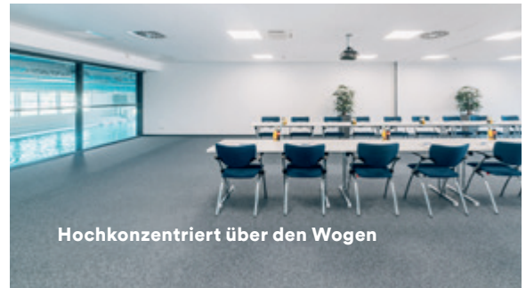
Hochkonzentriert über den Wogen

Neben einladender Dachterrasse, großzügigem Panoramafenster direkt in das Schwimmbad und modern reduziertem Design überzeugt das Rheinbad als Eventlocation durch die unmittelbare Nähe zu Messe und Flughafen. Die Raumgröße beträgt 63 qm, eine Teilung in zwei Räume ist möglich. Optional kann das Interieur individuell ausgerichtet werden, Catering ist über unseren Kooperationspartner buchbar.