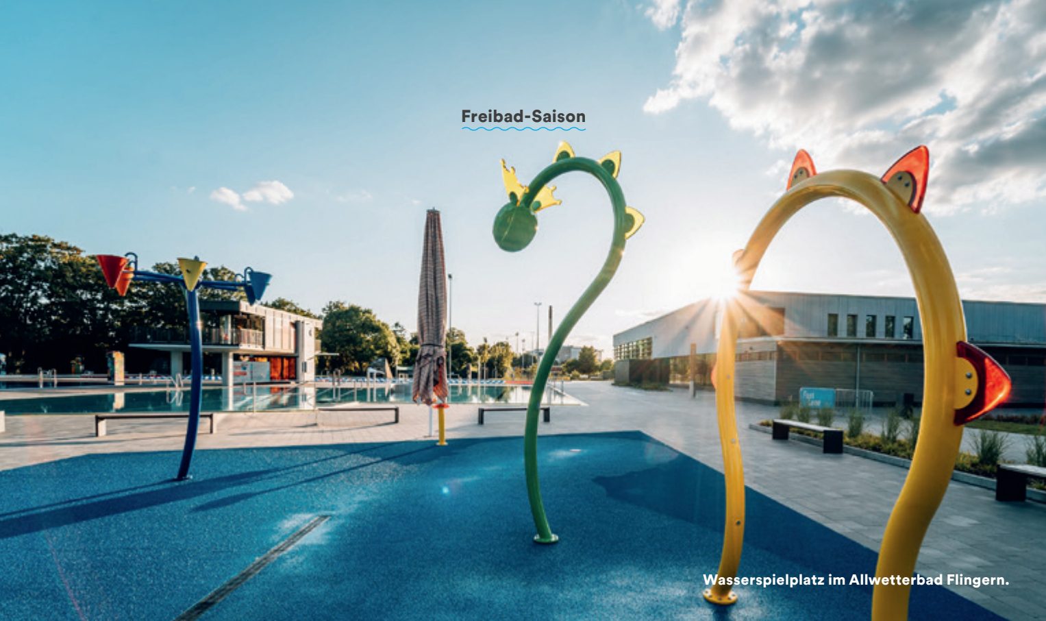
Wasserspielplatz im Allwetterbad Flöngern.

sowie ein Beachvolleyballfeld garantieren Spaß für alle Freiluftfans.