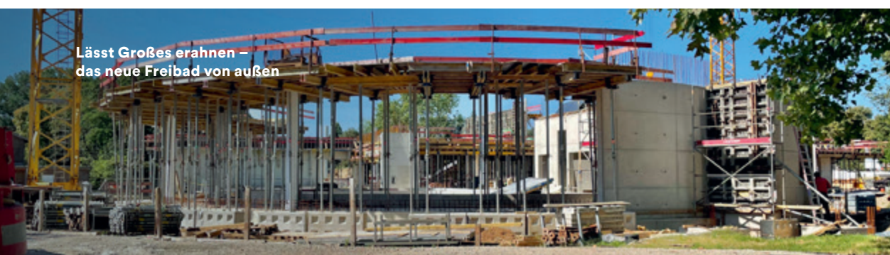
Lässt Großes erahnen – das neue Freibad von außen

Die mit Spannung erwartete Eröffnung rückt näher. Das Freibad wird ebenfalls aufwendig saniert und lädt voraussichtlich rechtzeitig zur Sommersaison 2023 zum Sonnenbaden und Wasserspaß ein. Wer sich auf dem Laufenden halten will, findet auf www.baeder-duesseldorf.de aktuelle Informationen.